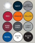
Farben Snapback siehe Seite 9