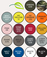
Farben Snapback siehe Seite 9