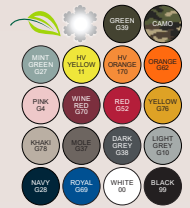
Farben Snapback siehe Seite 9